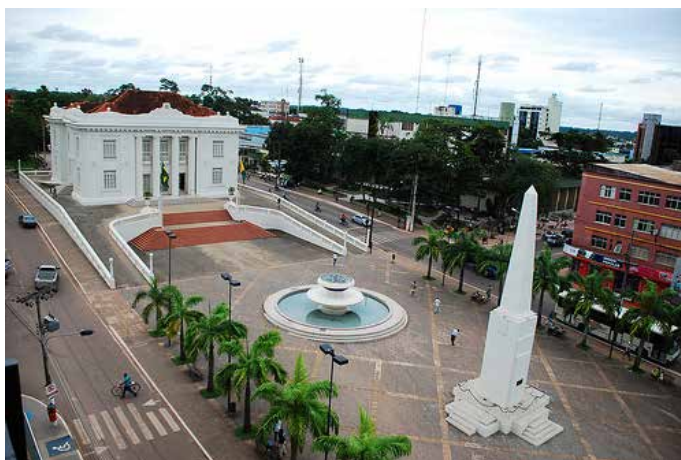
Figura 4 - Vista aérea do Palácio Rio Branco - março de 2009

Chama a atenção, no entanto, que a restauração do edifício em 2002, além de renovar o prédio, trouxe, também, a renovação dos elementos arquitetônicos que compunham sua ambiência no governo de Guiomard Santos, formando um conjunto arquitetônico que silenciava Hugo Carneiro e rendia claras homenagens ao autor do Projeto de Lei do Acre Estado.