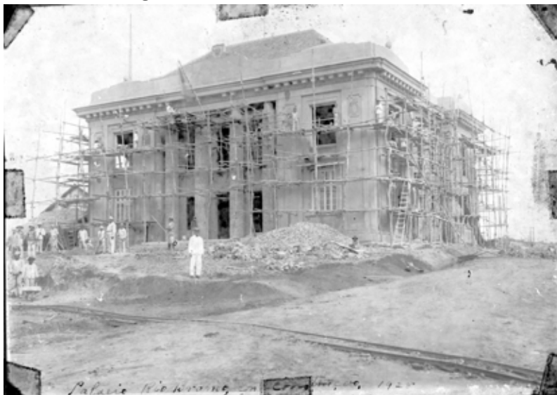
Figura 3 - Palácio Rio Branco em construção