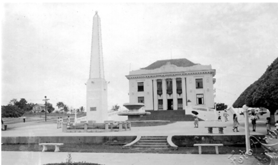
Figura I - Vista frontal do Palácio Rio Branco – Década, 1950.